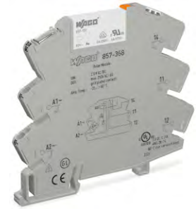
写真は外観が同等の製品

* 金接点部を保護するため、規定の電圧 / 電流値を超えない範囲でご使用ください。 規定以上の電圧 / 電流値を超えた場合、接点部の金が蒸発し、これがハウジング内に蒸着することによってリレー自体の誤動作を誘発する可能性があります。 金メッキが損傷した場合、( ) 内の値が有効となります。