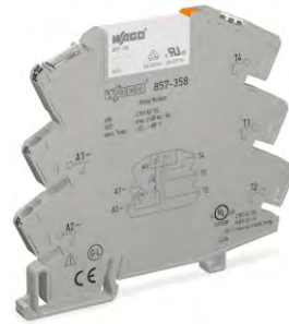
写真は外観が同等の製品