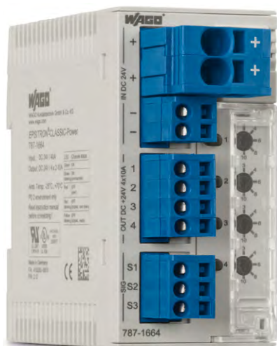
写真は外観が同等の製品