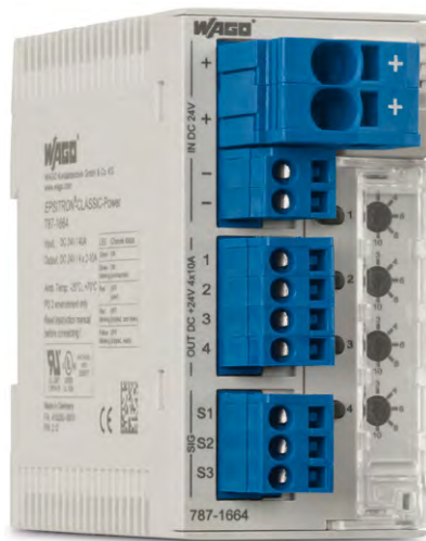
写真は外観が同等の製品